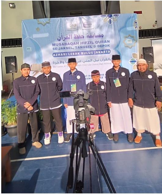
Santri memenangkan Juara 2 dan Juara 3 pada Lomba Khitobah